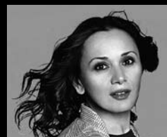
ΕΛΕΝΑ ΚΕΛΕΣΙΔΗ Σοπράνο