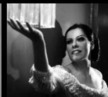
ΒΑΣΙΛΙΚΗ ΚΑΡΑΓΙΑΝΝΗ Σοπράνο