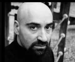
ΓΙΑΝΝΗΣ ΧΡΙΣΤΟΠΟΥΛΟΣ Τενόρος