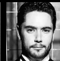
ΔΙΟΝΥΣΗΣ ΣΟΥΜΠΗΣ Βαρίτονος