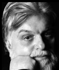
Βασίλη Νικολαΐδης Σκηνοθέτης

Παρουσίαση του βιβλίου του Βασίλη Νικολαΐδη «Μαρία Κάλλης: Μεταμορφώσεις μιας τέχνης» Αποσπάματα διαβάζει η ηθοποιός Θεοδώρα Σιάρκου