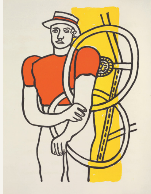
Fernand Léger, „Aus dem Malerbuch „Zirkus“, Lithografie, Tériade Editeur, Paris 1955 Sammlung Classen im Kunstmuseum Pablo Picasso Münster © VG Bild-Kunst, Bonn 2015