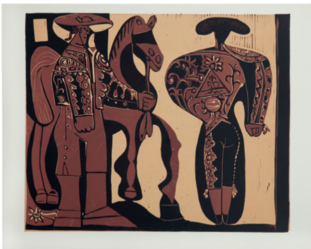
Pablo Picasso Picador und Torero, bereit zum feierlichen Einzug der Stierkämpfer, 1959, Farblinolschnitt, Kunstmuseum Pablo Picasso Münster